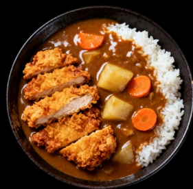
Chicken curry With rice €13.90