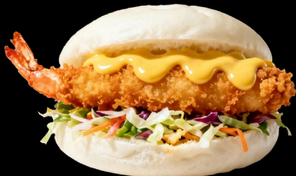
GUABAO EI €6.00 Pane al vapore con tempura di gamberi, insalata di verdure miste, maionese