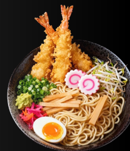
EBI SUPU RAMEN Gamberi tempura, noodles, naruto, cipollotto, germogli di soia, bambù marinato, verdure, uovo marinato €14.90