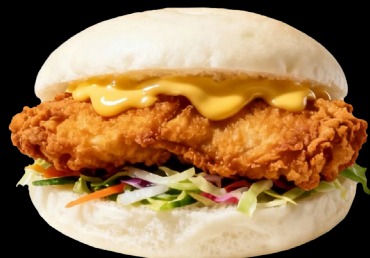
GUABAO KARA €6.00 Pane al vapore con con pollo fritto, insalata verdure miste, maionese