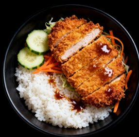
Chicken katsu With rice €13.90