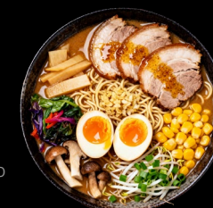
MISO RAMEN Chashu maiale, noodles, olio all'aglio, uovo marinato, bambù marinato, verdure, mais, germogli di soia, cipollotto, funghi speciali €13.90