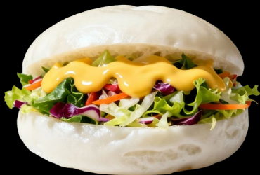
GUABAO VEGETARIANO €4.50 Pane al vapore con insalata di verdure miste, maionese