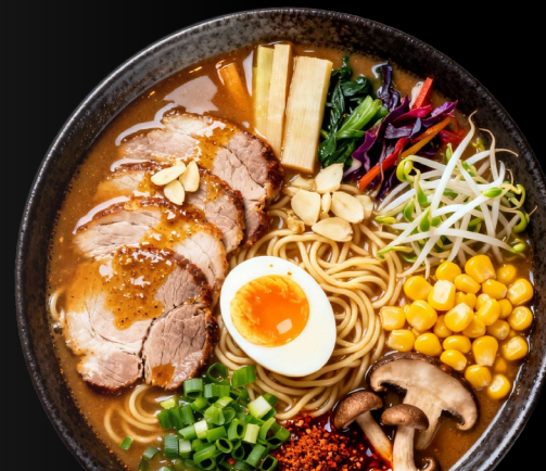
SPICY MISO RAMEN Chashu maiale, noodles, olio all'aglio, uovo marinato, bambù marinato, verdure, mais, germogli di soia, cipollotto, funghi speciali €13.90