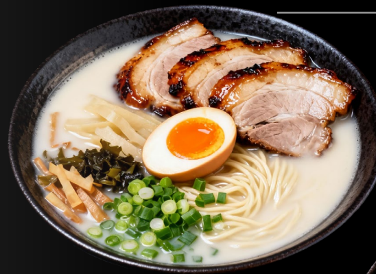
TONKOTSU RAMEN Chashu maiale, noodles, cipollotto, uovo marinato, verdure, bambù marinato €13.90