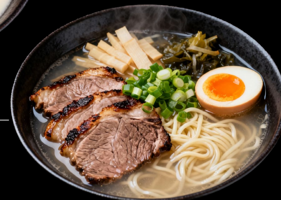
GYUKOTSU SHIO RAMEN Chashu di manzo, noodles, uovo marinato, cipollotto, bambù marinato, verdure €13.90